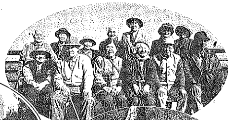
開通間近の しまなみ海道 が見える。

明るく楽しいおしゃべりと笑い声を聞くと、周りにはいるみんなもいつの間にか大きな声で笑っています。これからも、えぐもの仲間と共に元気に歌い、はしゃぎましょうね。