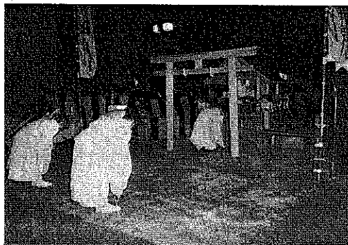
厳かに遷座祭が斎行される 5月6日

五月六日午後七時より、出雲大社広島教会をお迎えして、三恵会役員並びに地域の皆様方のご協力を賜り、遷座祭が斎行されました。